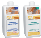
HG P73 HG P74