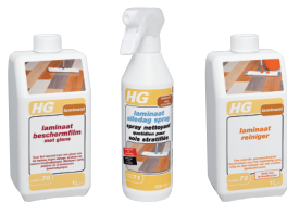
HG P70 HG P71 HG P72